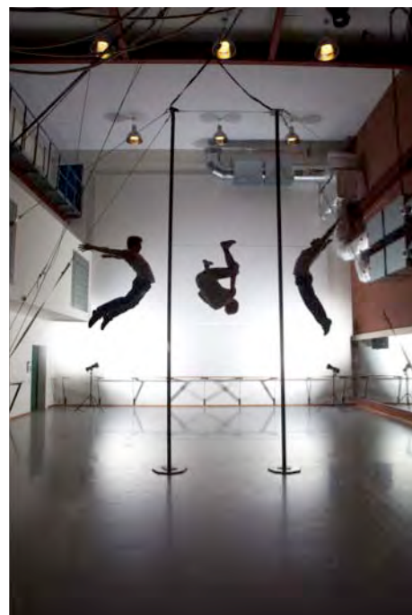
Sisters © Ben Hopper