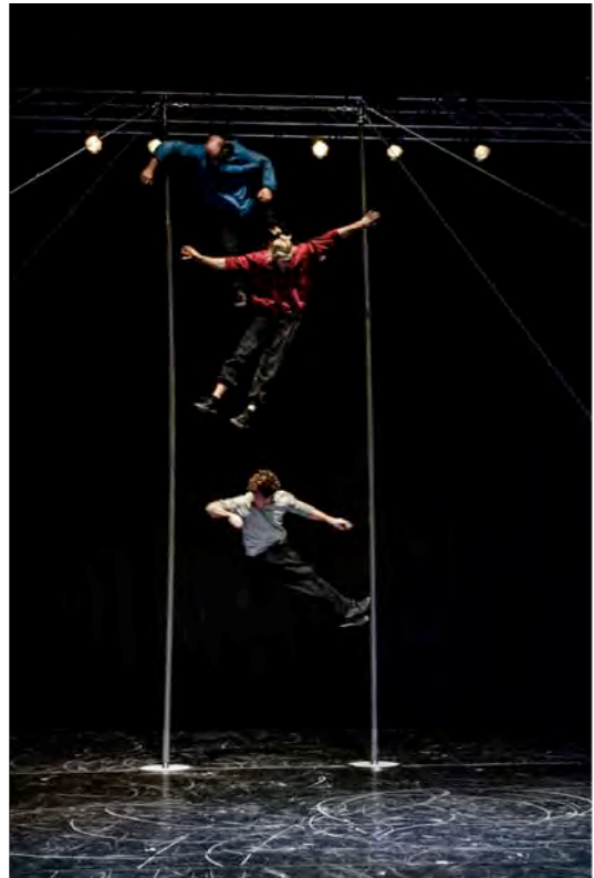
Sisters © Einar Kling-Odenkrants