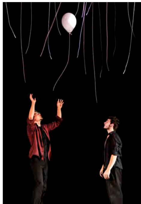
Nuua © André Baumecker