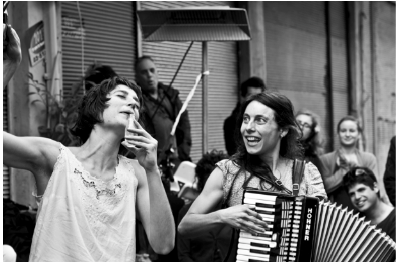
La Boca abierta