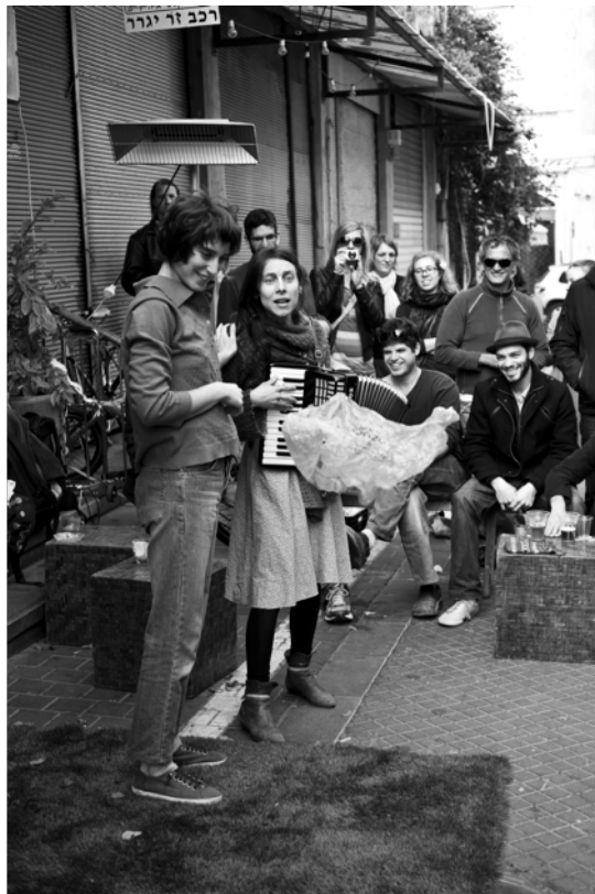
La Boca abierta